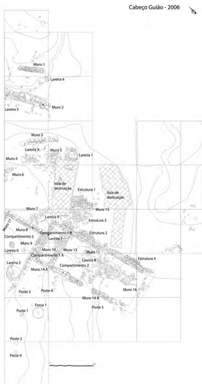
Fig. 2 - Cabeço Guião (Cartaxo). Planta das estruturas habitacionais identificadas (Arruda et al. 2017b: 323, fig. 4).

(Cardoso - Encarnação 2013: 136-138, figs. 4 e 7-8).