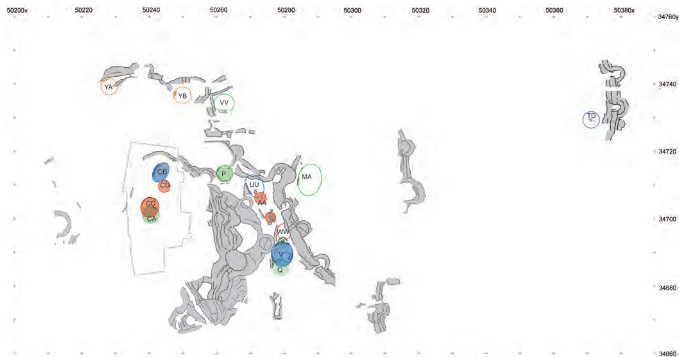
Fig. 1 - Zambujal (Torres Vedras). Planta das estruturas habitacionais identificadas. Correspondência das cores: verde: fase 1; amarelo: fase 2; azul: fase 3; vermelho: fase 4 (Kunst 2013: 196, fig. 3, atualizado por Guida Casella, segundo indicações de Michael Kunst) (ver versão digital).

- Henriques 2014: 20). Trata-se de um alinhamento pétreo de forma oval, apenas parcialmente escavado, com cerca de 4 m de largura máxima e 3 m de comprimento visível, que foi interpretado como embasamento de uma cabana construída em troncos e ramagens e revestida com argila, como indicam os fragmentos de ‘barro de cabanas’ recolhidos (Leitão - Henriques 2014: 20, fig. 8). Junto a esta, foram escavadas mais três estruturas habitacionais: uma estrutura de forma elíptica alongada, com aproximadamente 5 m de comprimento e 1,8 m de largura máxima, uma estrutura de forma circular com cerca de 1,5 m de diâmetro, delimitada por pedras de média dimensão e uma estrutura elíptica ou circular, da qual somente se conservou um segmento com cerca de 1,3 m de comprimento (Leitão - Henriques 2014: 20-21, fig. 9).