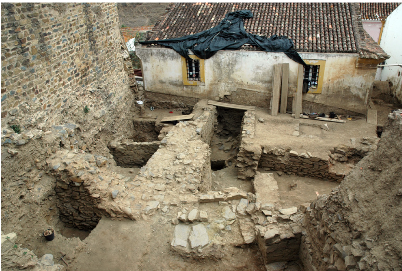
FIG. 3 Excavaciones en el solar de la Biblioteca Municipal de Mértola. Plataforma inferior con las estructuras correspondientes a la muralla romano-republicana sobre los restos de época protohistórica (M. Fátima Palma).

ser indisociable de un cambio de poderes políticos en la Câmara Municipal en el 2001 (Palma, com. pers.) 6 . En ese sentido, es útil recordar las palabras de la directora de las excavaciones: