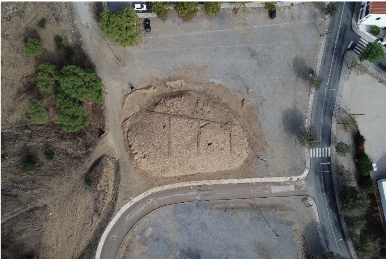
FIG. 4 La necrópolis del Terreiro da Feira en su contexto urbano tras las excavaciones del 2019

Los resultados preliminares de estas tres campañas, cuya publicación sistemática se encuentra en elaboración, apuntan a que la ocupación de esta necrópolis de incineración se extendió entre finales del siglo VI a.C. y el siglo IV a.C., revelando existencia de abundantes importaciones en los ajuares (p.ej., los nezems publicados recientemente por Valério et al. 2023). En este contexto, cobra especial importancia la celebración de un seminario internacional en la Universidad de Sevilla titulado Myrtilis: Un puerto global en la Edad del Hierro