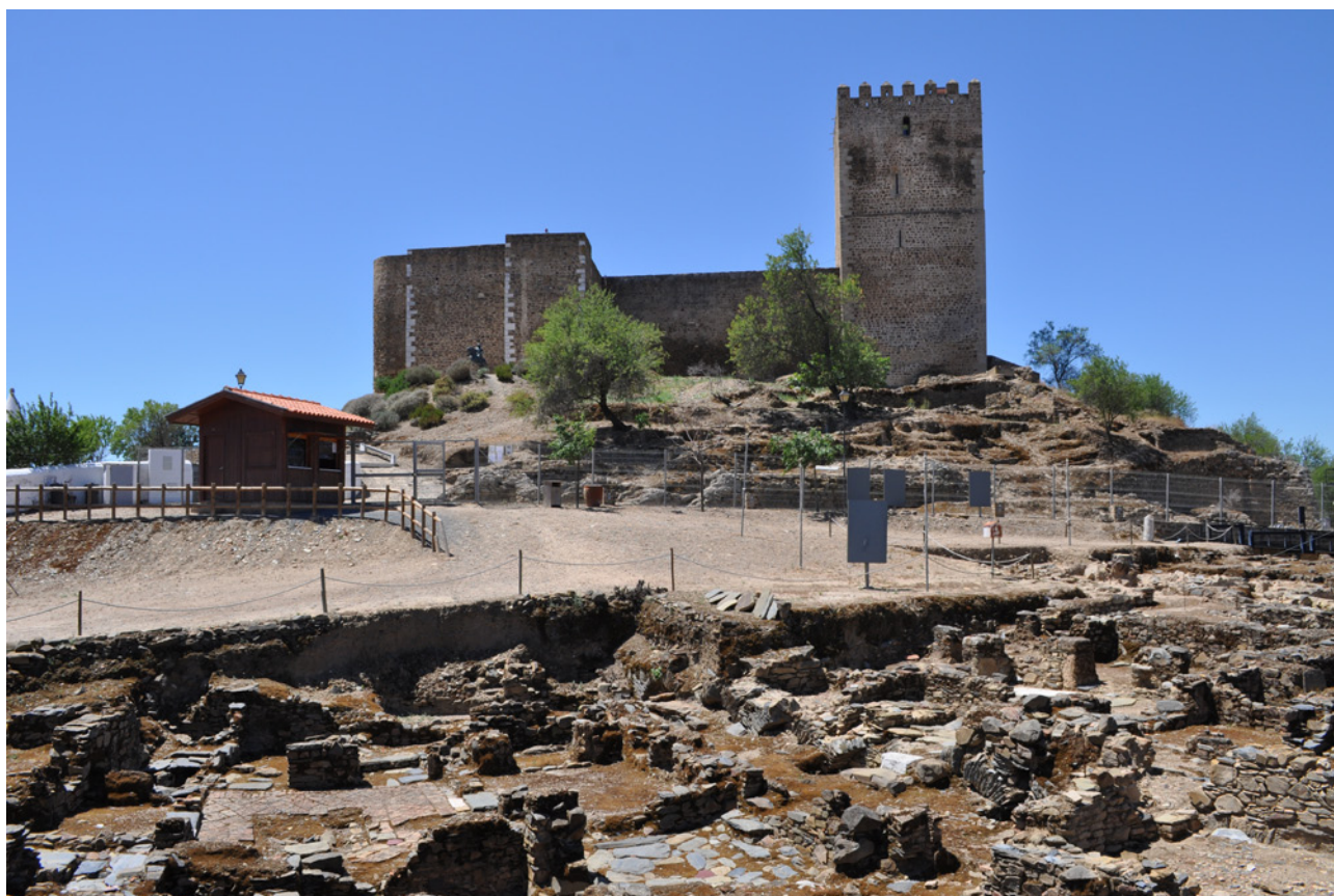
FIG. 2 Museu de Mértola. Nucleo museológico de la Alcáçova y Casa Islâmica (Autor).

antigua Myrtilis habría sido responsable de la difusión de materiales del “círculo gaditano” en áreas interiores como, p.ej., las minas de Neves-Corvo, donde también se aprecia una cantidad nada desdeñable de cerámicas áticas (cf. Ferreira 2022: 85ss.) y de vestigios de escritura del suroeste, fechados por Maia y Correa en el siglo V a.C. (Maia – Correa 1985).